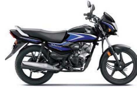
ब्लू के साथ ब्लैक