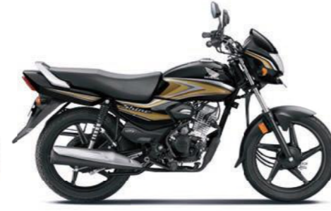
गोल्ड के साथ ब्लैक