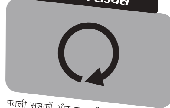
कम टर्निंग रेडियस

लाइट फ्रेम के चलते मोटरसाइकल का वज़न बहुत ज़्यादा नहीं होता जिससे इसे संभालना आसान होता है। इसका ड्युरेबल / टिकाऊ और मजबूत फ्रेम हर तरह की सड़क के लिए कामयाब है और भार लादने की भी सुविधा देता है।