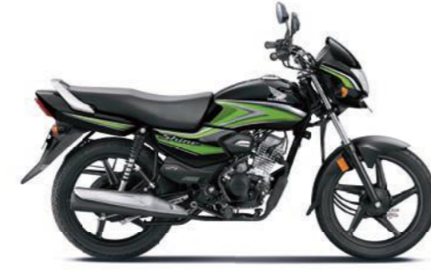
ग्रीन के साथ ब्लैक