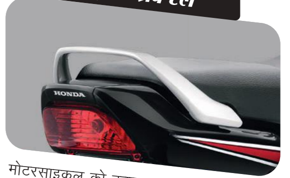
स्ट्रॉन्ग ग्रैब रेल