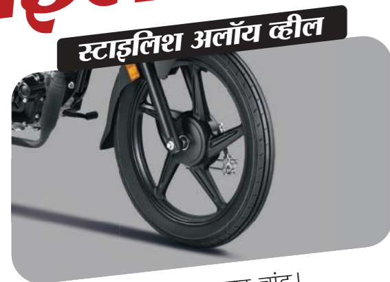
स्टाइलिश अलॉय व्हील