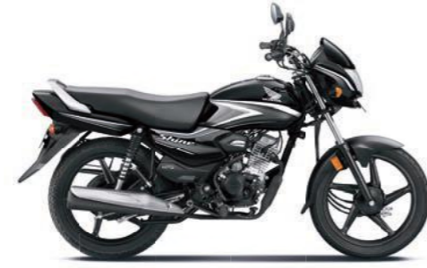
ग्रे के साथ ब्लैक

अभी ऑनलाइन बुक करें! www.honda2wheelerindia.com