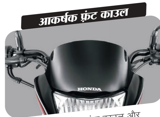
आकर्षक फ्रंट काउल

टैंक के साथ साइड ग्राफिक्स की खूबसूरती बढ़ाए आपकी शान।