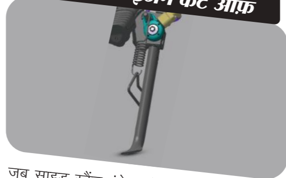
साइड स्टैंड इंजन कट ऑफ

जब साइड स्टैंड इंगेज हो और व्हीकल को गियर पर डाला जाए तो राइडर की सुरक्षा के लिए ये इग्निशन को कट ऑफ कर देता है।