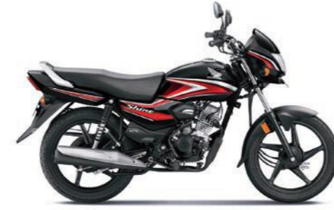
रेड के साथ ब्लैक