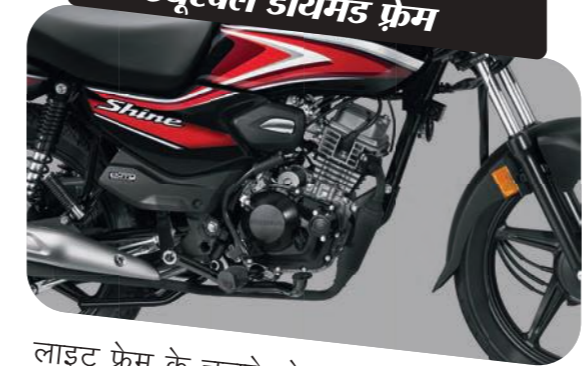
लाइट वेट और ड्युरेबल डायमंड फ्रेम

लाइट फ्रेम के चलते मोटरसाइकल का वज़न बहुत ज़्यादा नहीं होता जिससे इसे संभालना आसान होता है। इसका ड्युरेबल / टिकाऊ और मजबूत फ्रेम हर तरह की सड़क के लिए कामयाब है और भार लादने की भी सुविधा देता है।